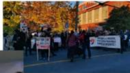
Célébration du 17 octobre à Sherbrooke