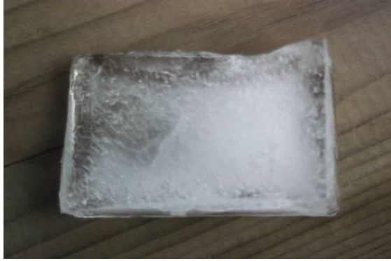
Photo 6. Photographie prise par une personne en situation de pauvreté pour illustrer la barrière de la communication

Le bloc de glace, c'est un médecin qui a reçu une formation scientifique, qui est bon médecin, mais qui est incapable de communiquer. Il s'agit, dans la manière de former les médecins, de choisir les candidats en médecine. La communication est aussi importante que la science. La capacité de rentrer en relation avec les gens, la barrière c'est la formation. (Militant ATD Quart Monde - ÉQUIsanTÉ)