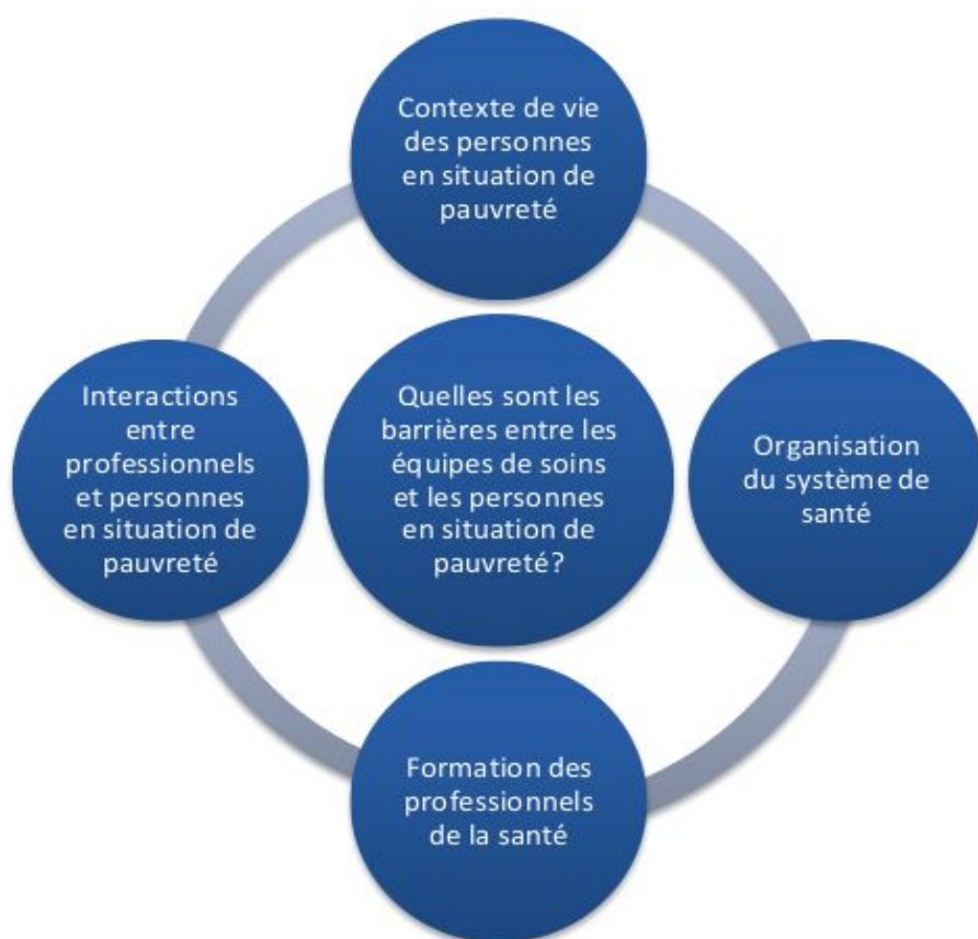
Schéma présentant les quatre barrières identifiées et analysées par le comité de pilotage du projet de recherche ÉQUISANTÉ :